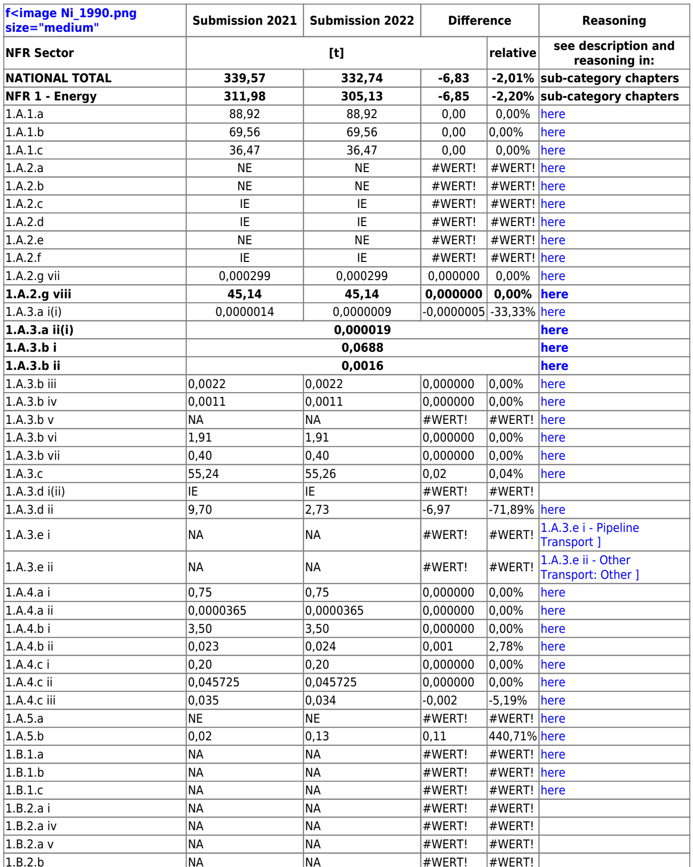
Table 1: Changes in emission estimates for 1990

The small changes in the National Total reported for 1990 (-1.2 t | -0.35 %) are dominated by a revision in NFR 2.G with -1.18 t or -46 % .